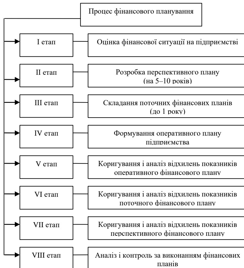
Рис. 2. Етапи фінансового планування господарюючого суб'єкта

На першому етапі фінансового планування проводиться комплексна оцінка фінансового стану підприємства за попередній період. Для цього використовуються дані фінансової звітності підприємства, а саме балансу (звіт про фінансовий стан), звіту про фінансові результати (звіт про сукупний дохід), звіту про рух грошових коштів (прямым і непрямим методом), звіту про власний капітал, примітки до фінансової звітності. Значна увага приділяється таким основним показникам діяльності підприємства, як ліквідності, платоспроможності, фінансової стійкості, рентабельності (збитковості) підприємства; обсягу реалізованої продукції (товарів, робіт, послуг), складу й структури витрат підприємства, складу і структури доходів за напрямками діяльності; фінансовим результатам за видами діяльності. Оцінивши фінансовий стан діяльності підприємства, постають проблеми, які необхідно вирішити.