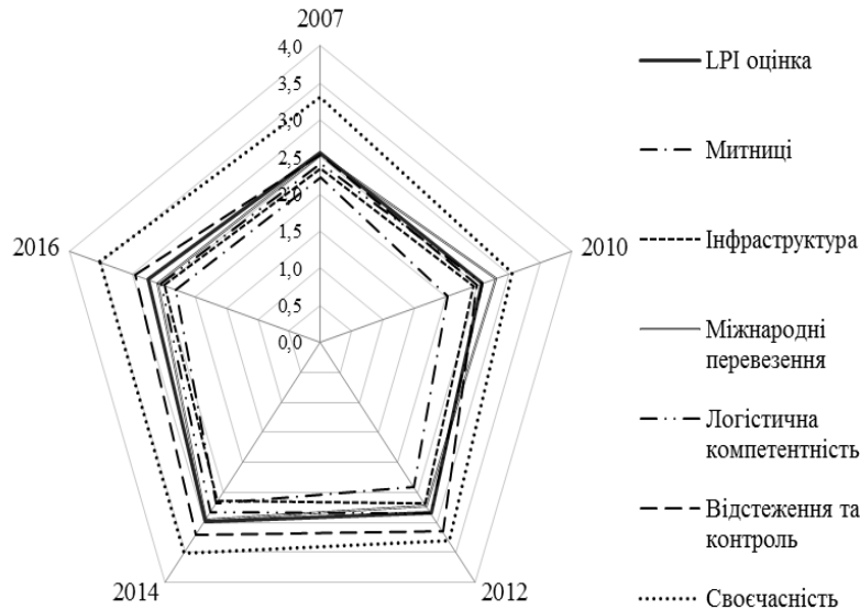
Рис. 2. Динаміка оцінок України за напрямками LPI у 2007-2016 роках за даними [8]

вантажів до пункту призначення в межах запланованого терміну поставки (3,51 станом на 2016 рік). Найбільш проблемними залишаються ефективність процесу оформлення прикордонними службами (2,30 станом на 2016 рік) та якість інфраструктури (2,49). Найбільш продуктивно за досліджуваний період Україна спромоглася покращити можливість відстеження і контролю вантажів ( ((2,96/2,53)-1)*100%=17\% ), найменше змін спостерігалось у сфері забезпечення простоти організації поставок за конкурентоспроможними цінами ( ((2,59/2,53)-1)*100%=2\% ) та прозорості митних служб ( ((2,30/2,22)-1)*100%=4\% ). Отримані результати ілюструють першочергові напрямки, на які необхідно звернути увагу для поліпшення ефективності логістики в Україні.