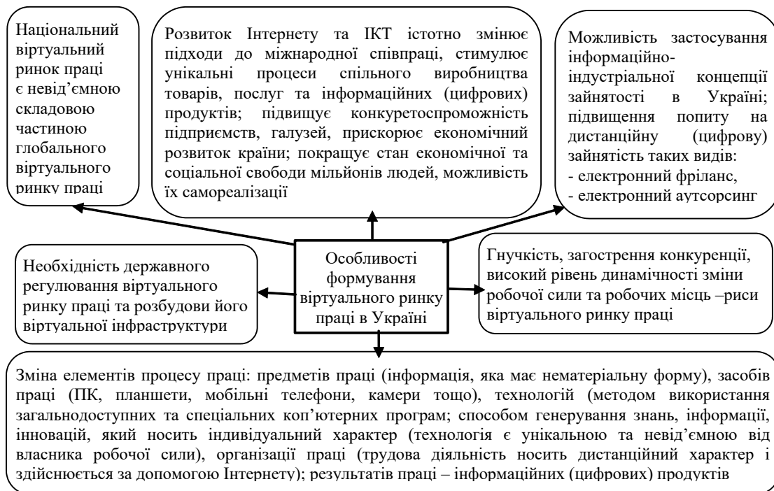
Рис. 2. Особливості формування віртуального ринку праці в Україні [10, 11, 12]

Особливості формування віртуального ринку праці в Україні наведені на рис. 2.