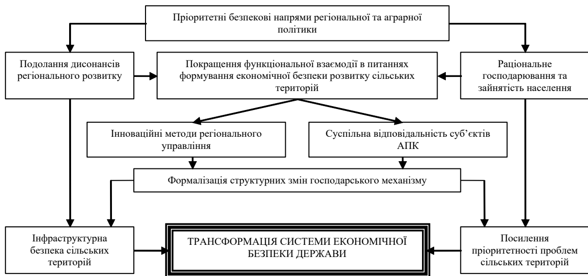
Рис. 2. Схема збалансування регіонально-галузових безпекових компонент господарського механізму розвитку сільських територій

3) мінімізації ризиків ведення господарської діяльності, шляхом поширення практики страхування врожаїв від негативного впливу несприятливих природно-кліматичних умов, стимулювання створення страхових резервних фондів покриття непрогнозованих збитків і понесених втрат суб'єктів господарювання;