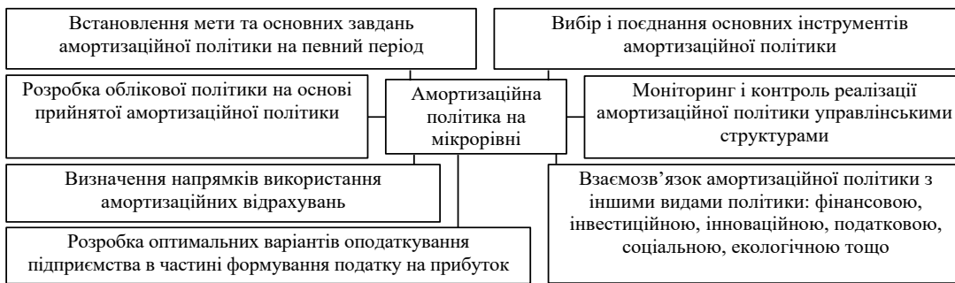
Рис. 3. Основні блоки формування амортизаційної політики на мікрорівні (побудовано автором на основі [3, 6, 11, 12, 13])

У цьому аспекті досить актуальним є твердження Т. М. Парфьорової, що амортизаційна політика підприємства є теоретично і науково обґрунтованою системою управління його амортизаційними ресурсами [11, с.10]. Тому наше бачення сутності амортизаційної політики підприємства – це обґрунтований вибір і оптимальне поєднання законодавчо дозволених способів, правил, методики нарахування та обліку амортизації, встановлення порядку використання амортизаційних відрахувань відповідно до умов господарювання, стратегічних цілей підприємства та у взаємозв'язку із іншими видами його політики. Основні її блоки на мікрорівні представлені на рисунку 3.