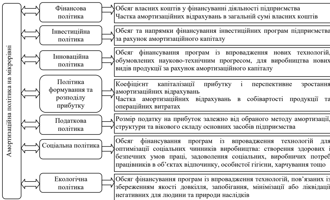
Рис. 4. Взаємозв'язок амортизаційної політики з іншими видами політики на мікрорівні (побудовано автором на основі [3, 6, 11, 12, 13])

Слід підкреслити, що визначені на рисунку 3 блоки щодо місця амортизації у мікроекономічному середовищі сприятимуть уточненню сутності амортизаційної політики підприємства, її складових та взаємозв'язку з іншими видами політики суб'єкту господарювання (рис. 4).