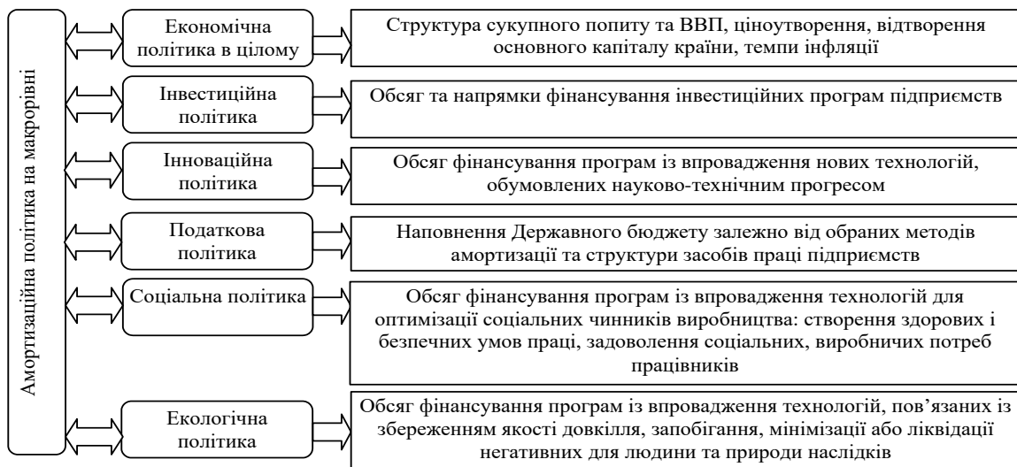
Рис. 2. Взаємозв'язок амортизаційної політики з іншими видами політики на макрорівні (побудовано автором на основі [1, 2, 6, 7, 11, 13])

Амортизаційна політика держави тісно пов'язана з іншими видами політики на макрорівні (рис.2).