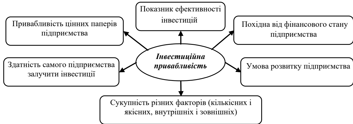
Рис. 1. Підходи до визначення інвестиційної привабливості (сформовано на основі [2, 3, 4])

Виклад основного матеріалу. Саме поняття інвестиційної привабливості підприємства дуже багатогранне і трактується неоднозначно. Систематизувавши точки зору, представлені в економічній літературі щодо визначення даного поняття, можна виділити кілька основних підходів (рис. 1).