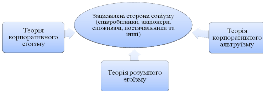
Рис. 1. Спрямованість теорій корпоративної соціальної відповідальності

якою єдиною відповідальністю бізнесу перед соціумом вважається збільшення прибутку акціонерів та власників компаній та інвесторів, оскільки будь-який бізнес намагається використати свої ресурси для задоволення свої інтересів. За теорією «корпоративного егоїзму» соціально відповідальною є та компанія, яка не порушує трудове, податкове, природоохоронне законодавство. Теорія «корпоративного альтруїзму» протилежна концепції М. Фрідмена. Вона з'явилась одночасно з рекомендаціями Комітету з економічного розвитку США (the Committee for Economic Development), що рекомендує вносити в обов'язки корпорацій матеріальну відповідальність компаній за рівень життя американського суспільства, добробут населення. Тому соціально відповідальна компанія сприяє розвитку внутрішнього та зовнішнього середовища свого бізнесу. Третя теорія «розумного егоїзму», стверджує, що соціальна відповідальність бізнесу – це його рівень розвитку, конкурентоспроможність, стабільні прибутки в довгостроковому періоді. При чому інвестиції корпорацій в людський капітал рівні створенню сприятливого соціального оточення для бізнесу та умов для стійкості прибутків, а заходи в сфері КСВ виступають інструментом покращення іміджу та репутації фірми.