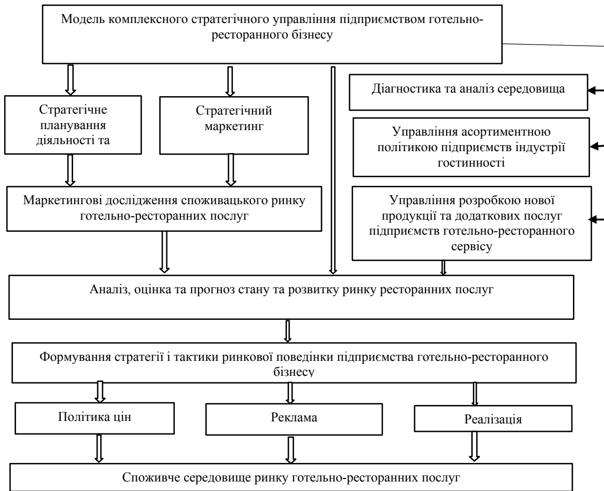
Рис. 1. Модель комплексного стратегічного управління підприємством готельно-ресторанного бізнесу

Слушною є думка Кошеєва С.В., який виділяє такі напрямки реалізації стратегій інтегрованого зростання в готельно-ресторанному бізнесі: створення ресторанных мереж, які об'єднують ресурси підприємств готельно-ресторанного бізнесу і суміжних галузей (стратегія суміжної диверсифікації); розширення форм роботи з відвідувачами за рахунок використання інформаційних технологій (стратегія віртуалізації каналів збуту) і залучення ресурсів фінансово-промислових груп (стратегія конгломератної диверсифікації) [3, с. 274].