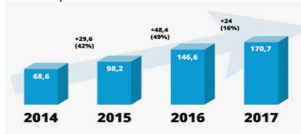
Рис. 1. Результати фінансової децентралізації [3]

В ухваленій урядом бюджетній резолюції, на 2017 рік закладено 170 млрд грн доходів місцевих бюджетів, на 2018 рік – 248 млрд грн, 2019 рік – 270 млрд грн, 2020 рік – 284 млрд грн. Ця резолюція яка засвідчила просування реформи децентралізації та її можливості що до збільшення бюджетів місцевих громад.