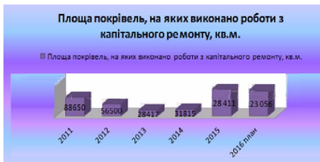
Рис. 3. Виконані роботи з капітального ремонту [4]

житлово-комунальному господарстві окрім фінансової стабілізації необхідно вдосконалити систему управління, забезпечити галузь ефективною нормативно-правовою базою та кваліфікованими кадрами. Отримавши додаткові можливості кожна громада повинна ефективно розпорядитися своїми бюджетами. В нашому місті розроблена “Програма розвитку та утримання житлово-комунального господарства м. Запоріжжя на 2017–2019 роки” [5]. Метою програми є підвищення ефективності та надійності функціонування ЖКГ, задоволення потреб населення у наданні житлово-комунальних послуг належної якості, що відповідає вимогам державних стандартів, з одночасним зниженням нераціональних витрат, забезпечення реалізації державної політики визначеної у сфері житлово-комунального господарства. Так завдяки додатковим надходженням до місцевого бюджету Запоріжжя в 2015 та 2016 рр. було виконано ремонтних робіт в галузі ЖКГ набагато більше порівняно з попередніми роками.