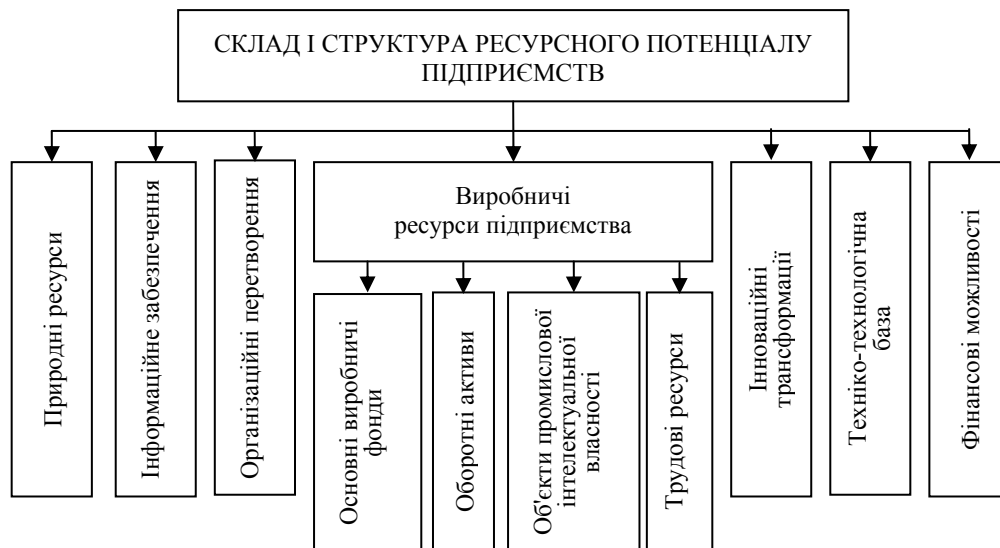
Рис. 2. Склад і структура ресурсного потенціалу підприємств

Складена на підставі огляду літературних джерел схема складу і структури ресурсного потенціалу підприємств представлена на рис. 2.