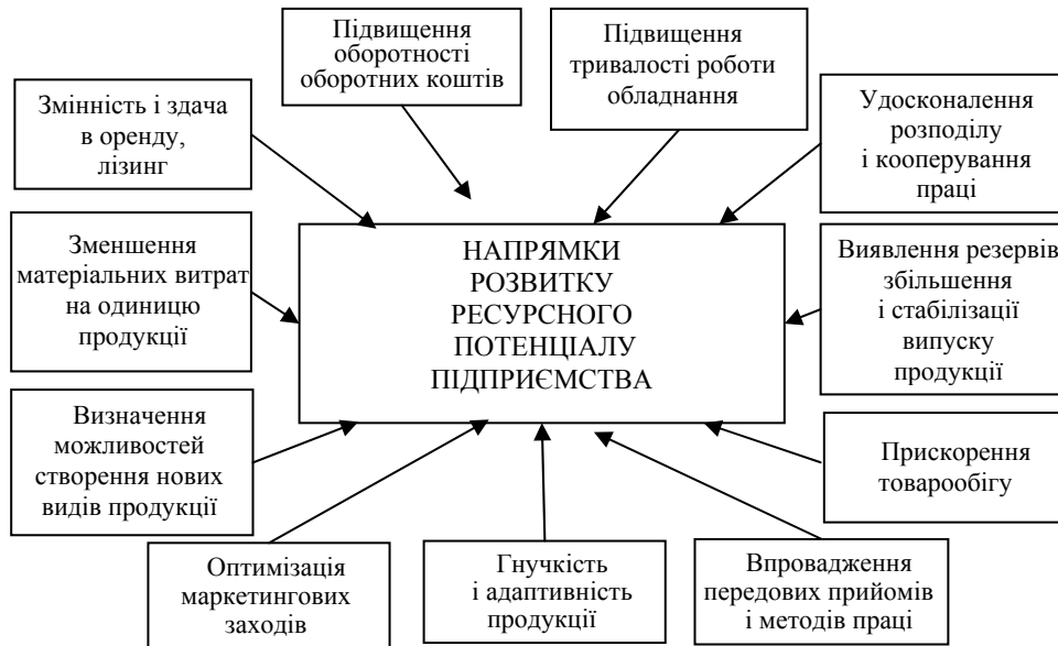
Рис. 5. Методи підвищення ресурсного потенціалу підприємств та його використання

Сьогодні, при виборі стратегії розвитку виробництва недостатньо обмежуватися оцінкою та обліком чинників перетворень. Різне скорочення термінів життя інновацій викликає підвищення інтенсивності появи на ринку нових товарів і послуг. Постійне оновлення асортиментних ліній на окремих товарних ринках призводить до застарілості і заміни новинок. Тому слід не тільки враховувати можливості інноваційної сфери, а й аналізувати достатність ресурсів для генерування високою інноваційною активністю і забезпечення нових технологій.