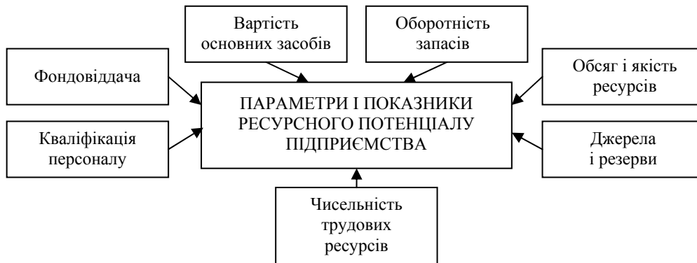
Рис. 3. Компоненти формування ресурсного потенціалу підприємств

більших результатів. Ефективність, це комплексне відображення кінцевих результатів використання всіх ресурсів підприємства за певний період часу. Результати використання ресурсів підприємства кількісно відображаються в бухгалтерській звітності, в яку входять: чиста виручка від реалізації продукції; обсяг виробленої продукції; сума прибутку.