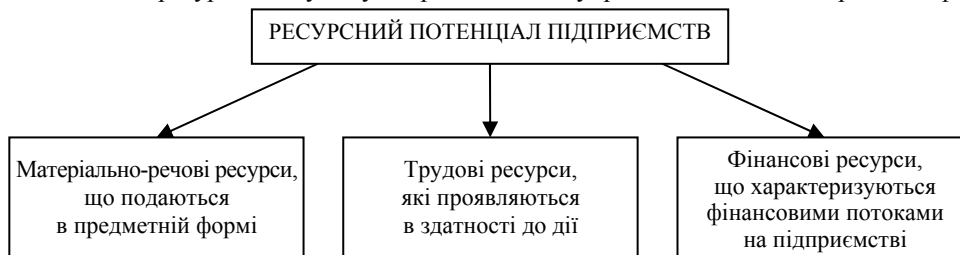
Рис. 1. Основні форми ресурсного потенціалу підприємств

Основні складові ресурсів можуть бути представлені в упредметненій і нематеріальній формі (рис. 1).