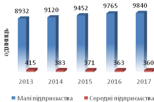
Рис. 1. Динаміка кількості малих і середніх підприємств у 2013–2017 рр.

Динаміка кількості малих та середніх підприємств Хмельницької області протягом 2013–2017 років зображена на рис. 1.