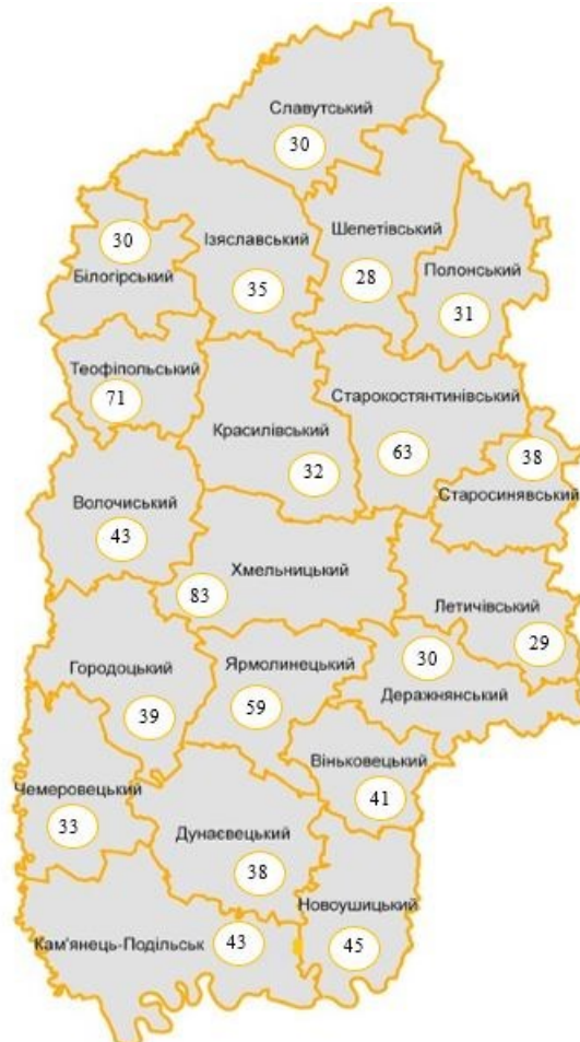
Рис. 4. Кількість малих і середніх підприємств у розрахунку на 10 тис. наявного населення, одиниць

Аналізуючи тенденції розвитку малого і середнього бізнесу, можна зробити висновок, що за останні роки в Хмельницькій області спостерігаються позитивні зрушення.