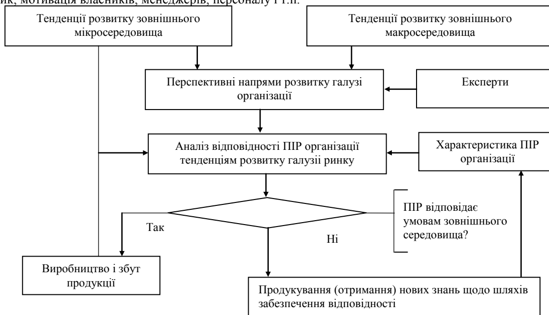
Рис. 2. Блок-схема алгоритму забезпечення відповідності ПІР організації умовам зовнішнього середовища (авторська розробка)

Вирішення третього завдання потребує стратегічного аналізу альтернативних варіантів використання знань, який передбачає використання комплексу критеріїв: фінансова вартість; термін окупності; стратегічна вартість; задоволення інтересів економічних контрагентів та контактних аудиторій; ризик; мотивація власників, менеджерів, персоналу і т.п.