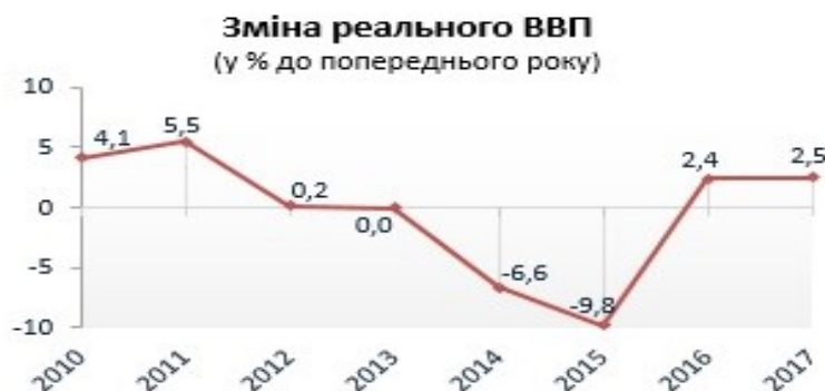
Рис. 3. Динаміка реального ВВП України [2]

Величина валового внутрішнього продукту, розрахованого за паритетом купівельної спроможності (ВВП за ПКС) на душу населення, скоротилася з 4 075 дол. у 2013 році до 1 562 дол. у 2016-му. У 2017 році за рівнем ВВП на душу населення Україна посіла 133 місце з показником 2205 доларів США, пропустивши вперед такі країни, як Мікронезію, Судан, Гондурас та інших економічних "тигрів". Поруч з нами – Папуа-Нова Гвінея, де рівень ВВП на душу населення майже дорівнює нашому і складає 2094 доларів [3].