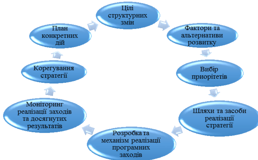
Рис. 4. Етапи формування структурної політики

Процес формування структурної політики в межах стратегічного планування здійснюється поетапно в певній послідовності (рис. 4). Тобто на першому етапі відбувається визначення цілей стратегічного планування в межах структурних перетворень визначених викликами глобального розвитку національної та світової економік. Далі проводиться аналіз факторів та формування стратегічних альтернатив, обґрунтування вибору та встановлення пріоритетів, на основі яких приймається стратегія та визначаються шляхи і засоби її реалізації. Для ефективного впровадження вибраної стратегії необхідно розробити програмні заходи, сформувати системи управління та механізм реалізації програмних заходів, проводити моніторинг реалізації заходів і досягнутих результатів та розробляти процедуру коригування стратегії. Як наслідок проведеної роботи відбувається розробка плану конкретних дій для урядових структур і органів державного управління в рамках реалізації структурної політики держави.