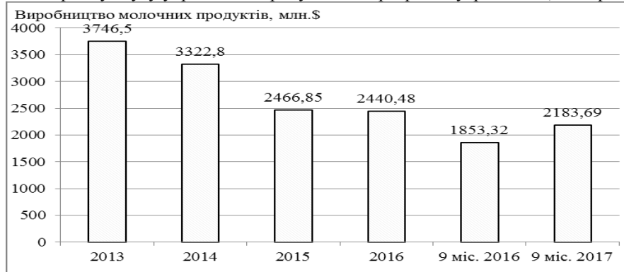
Рис. 1. Динаміка виробництва молочних продуктів в Україні [11]

послаблення позицій приватних фермерів, які не в повному обсязі та об'ємі здатні забезпечувати якість молока для молокозаводів, як це робиться на великих підприємствах. Поряд із цим, починаючи з 2016 р. на ринку спостерігається зростання виробництва продуктів з молока, вираженому в доларах США. Якщо у 2014 р. і 2015 р. грошовий обсяг цього ринку скоротився на 11,31% і 25,76% відповідно, то вже у 2016 р. спад склав усього 1,07%, а за підсумками трьох кварталів 2017 р. спостерігається зростання на 17,83% в порівнянні з аналогічним періодом попереднього року [2, 7–9]. Це підтверджує адаптацію вітчизняних виробників молочної продукції після негативних явищ у вітчизняній економіці, падіння попиту, а також фізичного скорочення ринку збуту української продукції як в розрізі внутрішнього, так і ринку зарубіжжя.