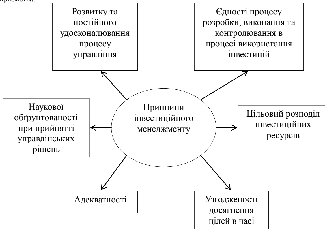
Рис. 1. Принципи, на яких ґрунтується інвестиційний менеджмент

Інвестування є відповідальним економічним рішенням з віддаленим і не завжди прогнозованим кінцевим результатом, від якого залежать як операційні прибутки, так і загальний стан та розвиток підприємства.