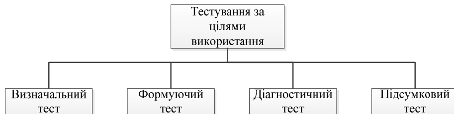
Рис.1.Класифікація тестів за цілями використання

За цілями використання тести поділяють на чотири базові групи (рис. 1).