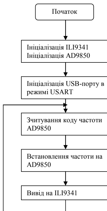
Рис. 6. Алгоритм роботи генератора

Алгоритм взаємодії між елементами пристрою показано на рис. 6.