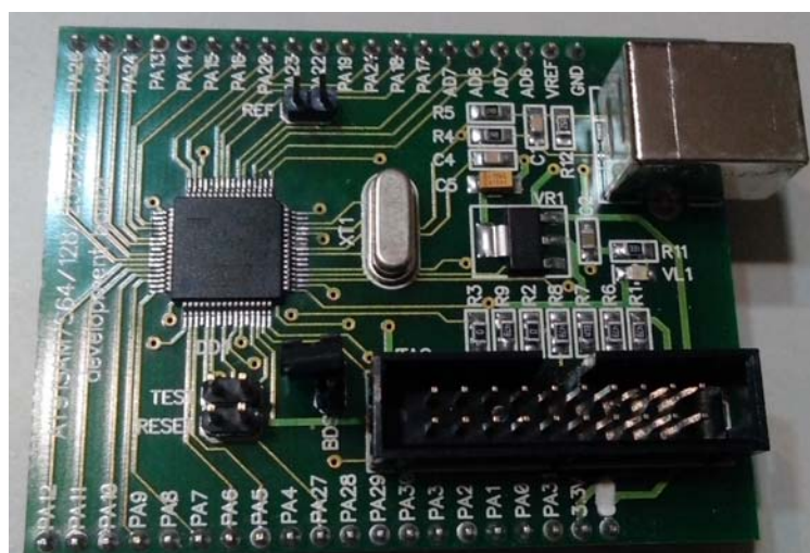
Рис. 3. Плата із контролером AT91SAM7S128

Для керування генератором застосовано мікроконтролер AT91SAM7S128 (рис. 3).