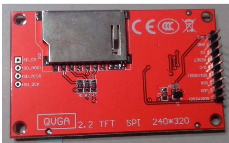
Рис. 4. TFT дисплей на базі контролера ILI9341 з SPI інтерфейсом

Контролер AT91SAM7S128 серії AT91SAM7 обрано через наявність бібліотек роботи з дисплеєм з контролером ILI9341. Контролер ILI9341 застосовується для побудови TFT дисплеїв. В проекті використаний QVGA дисплей 2.2" (рис. 4.).