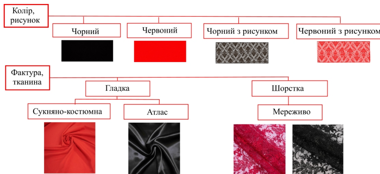
Рис. 7. Кольорово-фактурні ознаки тканини виробів

Колекція виготовлена з сукняно-костюмною тканини червоного кольору, а як додатковий матеріал використовується чорний атлас з гладкою фактурою. Крім того, вироби прикрашає мереживо з шорсткою фактурою (рис.7).