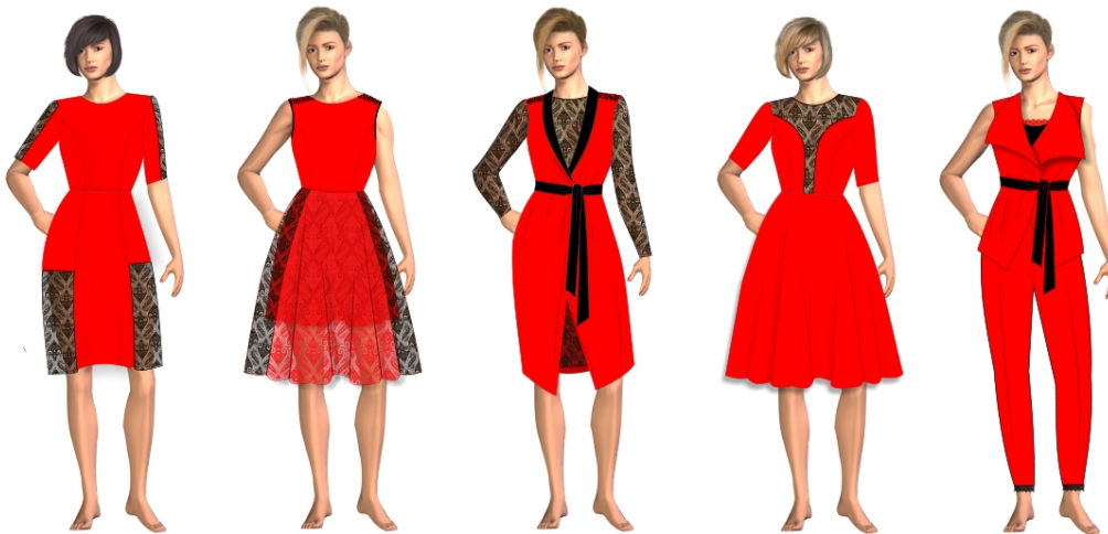
Рис. 3. Творчі ескізи колекції жіночого одягу

Остаточні ескізи моделей колекції виконано за законами композиції із чітким опрацюванням пластики форми, силуету, застосуванням принципу пропорційності між елементами виробів з використанням особливостей матеріалу – кольору та фактури (рис/ 3).