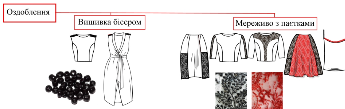
Рис. 8. Види оздоблення моделей колекції

З метою створення завершеного гармонійного образу колекції стилістика виробів передбачає використання мережива, яке розшите паетками, та вишивку бісером для підсилення візуальної екстравагантності, чуттєвості та емоційного ефекту образу, і водночас об'єднання всіх виробів [8] (рис. 8).