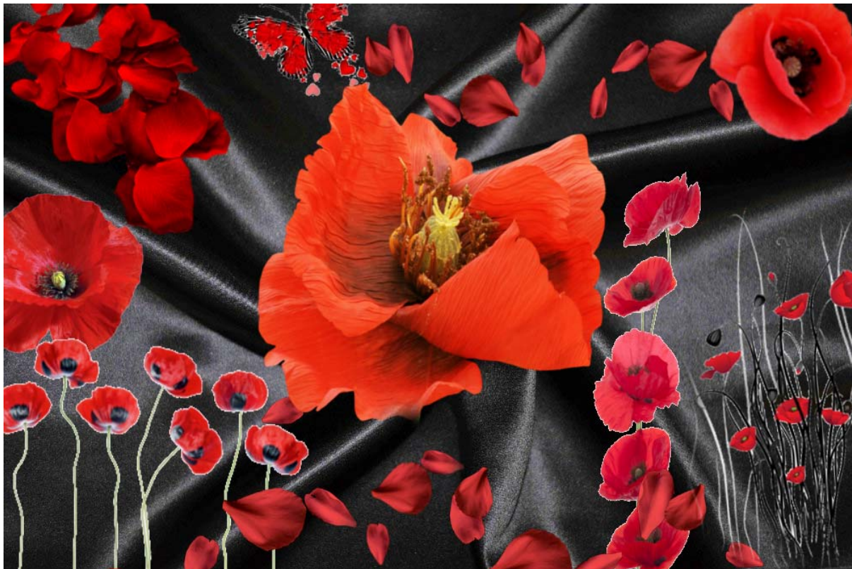
Рис. 1. Колаж творчого джерела

На основі аналізу творчого джерела виділено притаманні лише йому специфічні ознаки, які у повній мірі відповідають задуму і модним тенденціям. Виявлено колористичні рішення, об'ємність, форму, пластику джерела, фактуру його поверхні, а також стиль. На цьому етапі дизайн-проекування виконано серію фор-ескізів, в яких джерело трансформовано в умовно-узагальнений стилізований образ (рис. 2).