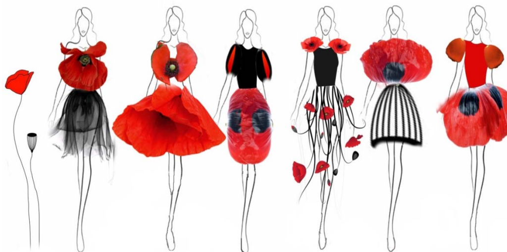
Рис. 2. Фор-ескізи моделей колекції

В результаті аналізу фор-ескізів щодо новизни та оригінальності відповідно до концепції та напрямку моди сформовано узагальнене бачення моделей колекції, визначено основні форми та елементи проєктованих виробів, які лягли в основу творчих замальовок колекції. Виробам притаманні плавні лінії, гармонійне співвідношення, об'ємні форми низу виробів та прилеглий, напівприлеглий верх. Головний акцент – червоний колір з чорними вставками.