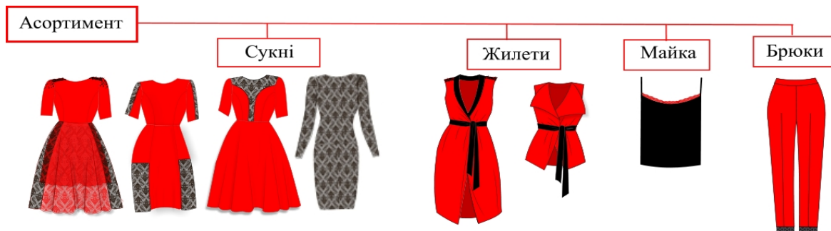
Рис. 4. Асортимент виробів колекції

Стильове рішення нав'язане квітковими образами, тому колекція виконана в класично-романтичному стилі. Колекцію складають вироби широкого асортиментного ряду, зокрема сукні, брюки, жилети, майки, які можуть утворювати різні комплекти (рис. 4).