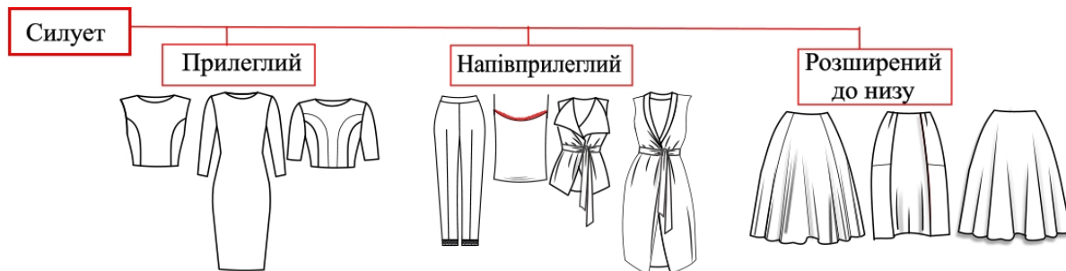
Рис. 5. Силуетні рішення виробів колекції

Силуетні рішення виробів реалізовано через прилеглий, напівприлеглий та розширений до низу крій. В моделях гармонійно поєднано малі і великі об'єми, що відображено в пишних спідницях і прилеглому верху (рис. 5).