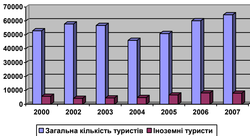
Рис. 1. Динаміка зростання обсягу туристів, які перебували у Чернівецькій області (2000-2007 рр.) [1]

Здається, що вказані цифри повинні говорити про те, що готельне господарство області позитивно впливає на залучення іноземних гостей. Однак насправді порівняння можливостей