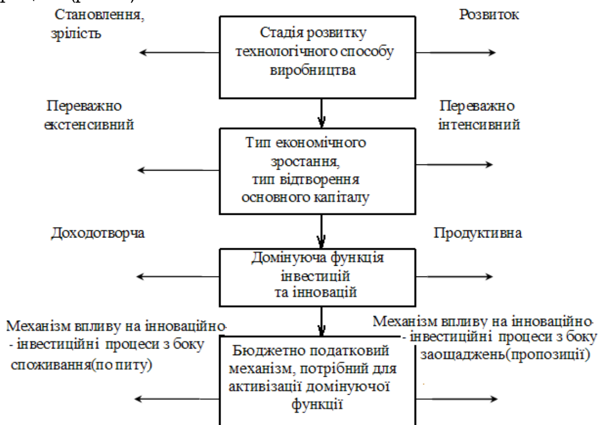
Рис. 2. Логіка формування механізму БПП: еволюційний підхід

виробництва. Саме вона, детермінуючи характер і ступінь змін у матеріально-технічній базі суспільного виробництва, "програмує" економіку на конкретний тип економічного зростання (переважно екстенсивний чи переважно інтенсивний) та визначає домінуючу у конкретно-історичних умовах функцію інвестицій, на стимулювання якої і повинні спрямовуватися регулюючі зусилля держави. Відповідно з можливостями виконання цього завдання і обирається фіскальний механізм впливу на інвестиційні процеси (рис. 2).