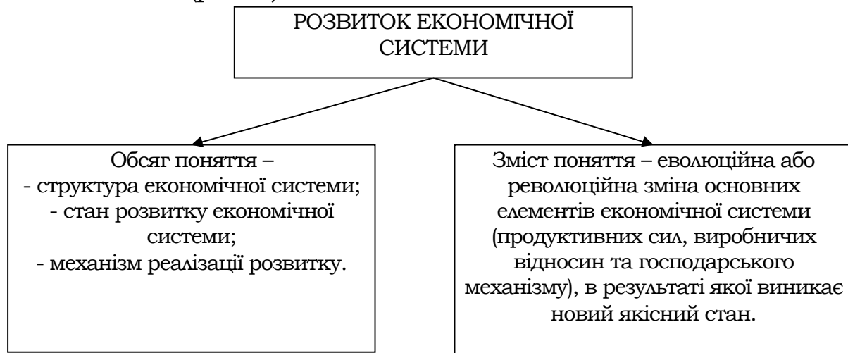
Рис. 1. Основні структурні елементи поняття «розвиток економічної системи»

Кожній стадії розвитку економічної системи відповідає певна структура (структура економічної системи), стан (кількісні та якісні характеристики) та механізм реалізації розвитку, які і формують обсяг поняття (рис. 1).