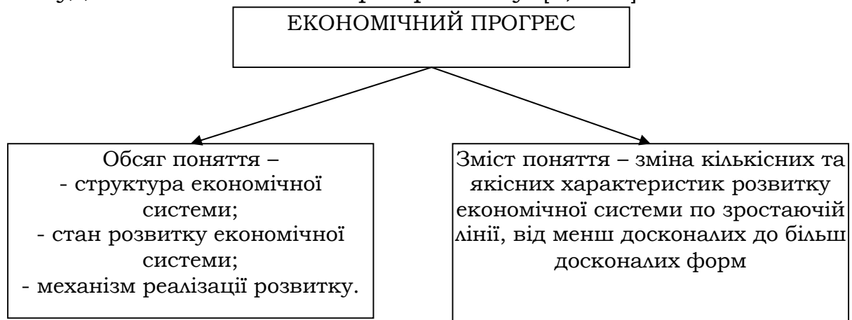
Рис. 3. Основні структурні елементи поняття «економічний прогрес»

Саме економічний прогрес, на думку багатьох економістів, закладено в основу суспільного прогресу, який, крім економічного поступального розвитку, передбачає соціальний, політичний, правовий, культурний, духовний тощо. Зокрема, російські економісти А.В.Бузгалін та А.І.Колгонов розглядають економічний прогрес «...як історично існуючу...основу суспільного прогресу, при цьому постійно акцентуючи увагу на тому, що люди та їх об'єднання самі створюють свою історію за об'єктивними законами, що економічно ніколи не було єдиним, а в перспективі і не буде головним каталізатором розвитку» [8, с.81].