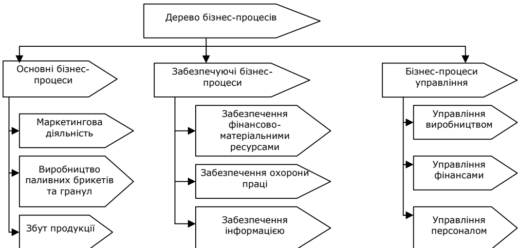
Рис. 3. Модель „Дерево бізнес-процесів” ПП „Біопаливо”

Для побудови моделі „Дерево бізнес-процесів” використовуємо найпоширенішу класифікацію бізнес-процесів на: основні, допоміжні, управління та розвитку. Для побудови даної моделі та її деталізації використовуємо базові характеристики бізнес-процесу: основні, забезпечення та управління. Спираючись на ці три характеристики бізнес-процесу, пропонуємо модель „Дерево бізнес-процесів” для підприємства альтернативної енергетики ПП „Біопаливо” (рис. 3).