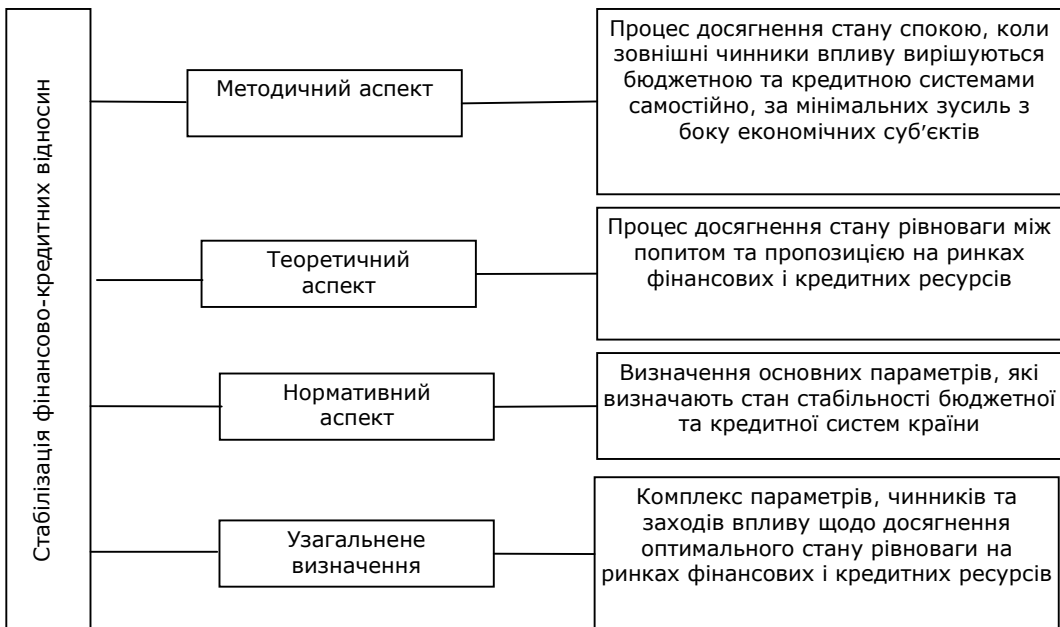
Рис. 2. Узагальнення змісту поняття «стабілізація фінансово-кредитних відносин»

Підсумовуючи, можна зробити висновок, що стабілізація фінансово-кредитних відносин є багатоаспектним поняттям і характеризує комплекс параметрів, чинників та заходів щодо досягнення оптимального стану рівноваги на ринках фінансових та кредитних ресурсів (рис. 2).