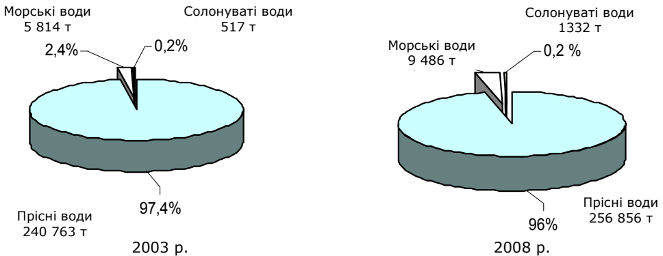
Рис. 3. Продукція аквакультури за типами водойм в ЦСЕ

яке у 2008 р. зросло на 16 093 т порівняно з 2003 р. (рис. 3). Збільшення виробництва продукції аквакультури спостерігається як за показником вилову з морських вод (зростання на 3 672 т у порівнянні з 2003 р.), так і за показником вилову з солонуватих водойм, який відповідно зріс на 815 т.