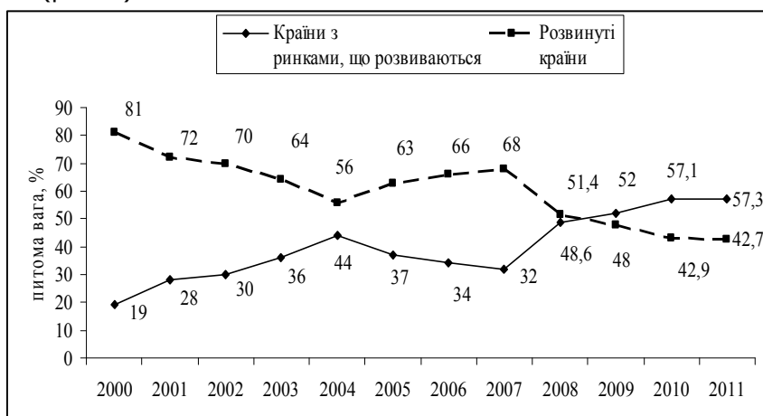
Рис. 2. Питома вага розвинутих країн та країн з ринками, що розвиваються у глобальному потоці ПІІ [6]

Розглянемо третю з необхідних умов можливості самоорганізації світової економіки в синергетичному розумінні – перебування її в стані, далекому від рівноваги. В даному аспекті відзначимо, що, хоча і з певною мірою обережності, але можна стверджувати, що сучасне світове господарство перебуває в такому стані. В рівновазі глобальна економіка має характеризуватися певними коливаннями параметрів в одну та іншу сторону. В сучасній світовій економічній системі спостерігаються довгострокові тенденції. На це зокрема вказує зміна співвідношення між традиційними центрами «ядра» сучасної глобальної економіки – тріадою «ЄС-США-Японія» та деякими іншими регіонами, насамперед Китаєм і меншою мірою, Індією за рядом показників. Особливо така зміна проявляється в розподілі глобального потоку ПІІ (рис. 2).