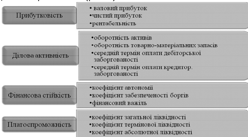
Рис. 1. Групи розрахункових показників для оцінки фінансово-економічного стану підприємства

Оцінку фінансово-економічного стану підприємства можна здійснювати за допомогою основних показників прибутковості, ділової активності, фінансової стійкості, платоспроможності (рис. 1):