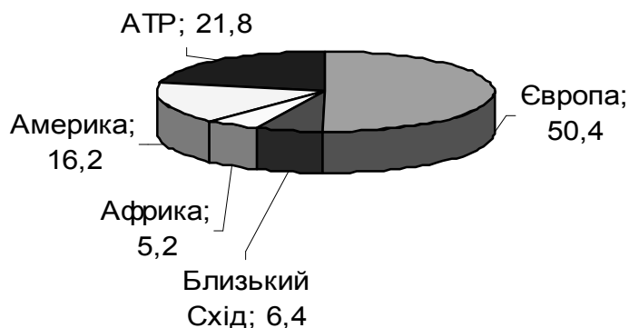
Рис. 1. Питома вага туристичних регіонів світу у просторовій структурі міжнародного потоку, 2010 р., %

Головним туристичним регіоном світу залишається Європа, на яку припадає 50,4% від загальносвітового обсягу туристичних прибуттів. На другій позиції із помітним відставанням утримується Азійсько-Тихоокеанський регіон (АТР), на третій – Америка. «Периферійним» туристичним регіоном світу є Африка (рис. 1).