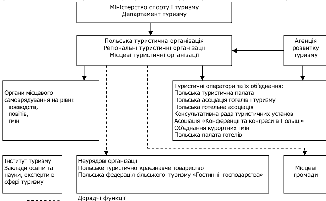
Рис. 2 Структура державного туристичного сектору Польщі*

Державне регулювання туризму в Польщі здійснюється Міністерством спорту і туризму, до складу якого входить департамент туризму, головною метою діяльності якого є розвиток та регулювання туристичної індустрії [9]. Стратегія розвитку туризму в Польщі у 2007-2013 роках проголошує, що для гармонійного розвитку туризму в Польщі необхідно багатостороннє співробітництво уряду, місцевих органів влади, приватного сектору, а також неурядових організацій [12]. Органом, що займається просуванням туристичних можливостей Польщі в країні та за кордоном, є Польська Туристична Організація (ПТО). ПТО є державною установою і головними завданням цього органу є просування Польщі як країни, привабливої для туристів, забезпечення функціонування та розвитку польської туристичної інформаційної системи та підтримка планів розвитку і модернізації туристичної інфраструктури. ПТО має філії в 14 країнах по всьому світу та планує рекламні кампанії, які включають в себе потреби окремих ринків [11]. Структура та учасники системи державного регулювання туризму Польщі наведені на рис 2.