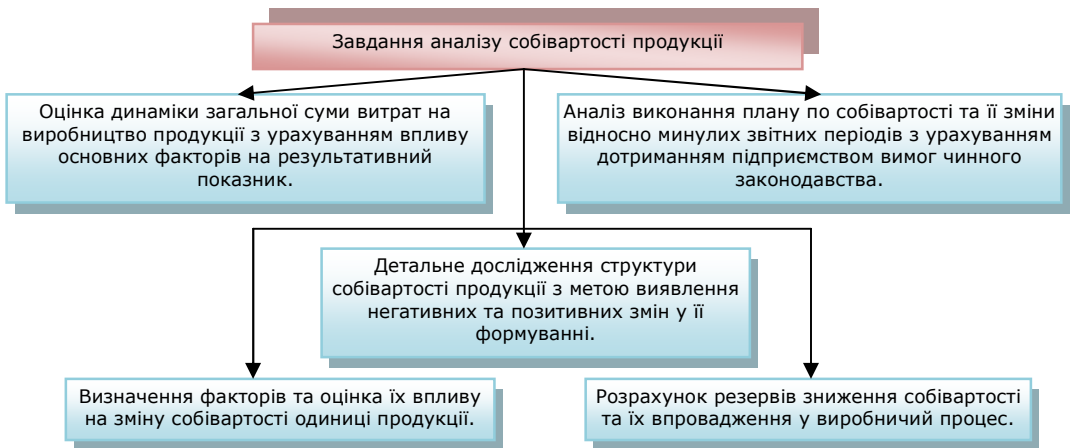
Рис. 2. Завдання аналізу собівартості продукції

Також одним з головних структурних елементів виділяють методику економічного аналізу – визначення послідовності та періодичності аналізу понесених витрат на виробництво. На нашу думку, на підприємствах з виробництва мінеральних вод потрібно проводити як попередній (перспективний), так і наступний (ретроспективний, історичний) аналіз.