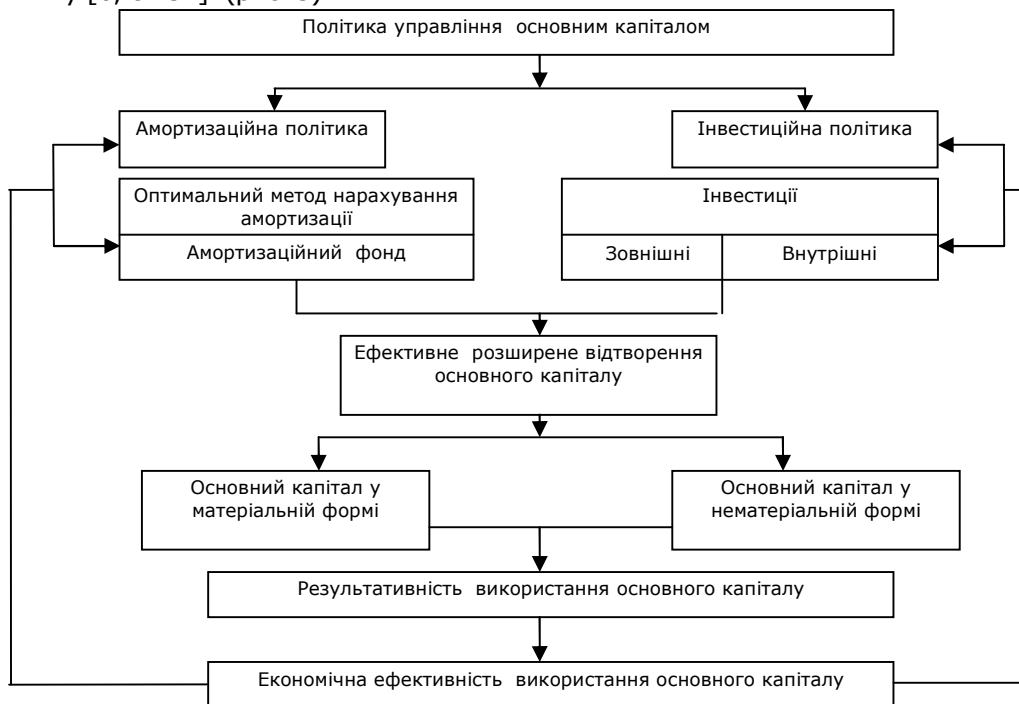
Рис. 3. Логічна модель процесу розширеного відтворення основного капіталу на основі політики управління основним капіталом

Для забезпечення розширеного відтворення основного капіталу підприємства, на нашу думку, доцільно використати розроблену Т. М. Ступницькою модель управління основним капіталом, що включає амортизаційну та інвестиційну політику [6, с.152] (рис. 3).