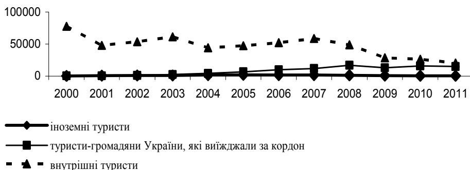
Рис. 2. Динаміка туристичних потоків по Полтавській області

Статистичні дані по Полтавському регіону також показують значну перевагу внутрішнього туризму, досить низьку частку іноземного туризму та стабільне зростання кількості виїзних туристів (рис. 2) [7].