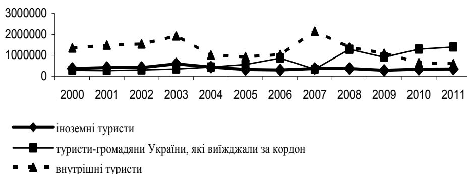
Рис. 1. Динаміка туристичних потоків по Україні

Держкомстату, всього впродовж 2011 року туристичними операторами Полтавської області обслужено 36 тис. туристів (на 7000 ос. менше, ніж у 2010 р.) і 28116 ос. екскурсантів (на 1460 осіб більше, ніж у 2010 р.), в тому числі за видами туризму: в'їзний – 431 особа (на 205 осіб менше, ніж за 2010 рік); виїзний – 15163 особи (на 831 особу менше, ніж за 2010 рік); внутрішній – 20405 осіб (на 6014 осіб менше ніж за 2010 рік) [7]. Динаміка туристичних потоків за останнє десятиліття показує, що на українському ринку переважав внутрішній туризм, виїзний туризм набув значного розповсюдження лише з 2005 року, іноземний туризм стабільно перебуває на рівні близько 40 тис. туристів на рік (рис. 1) [6].