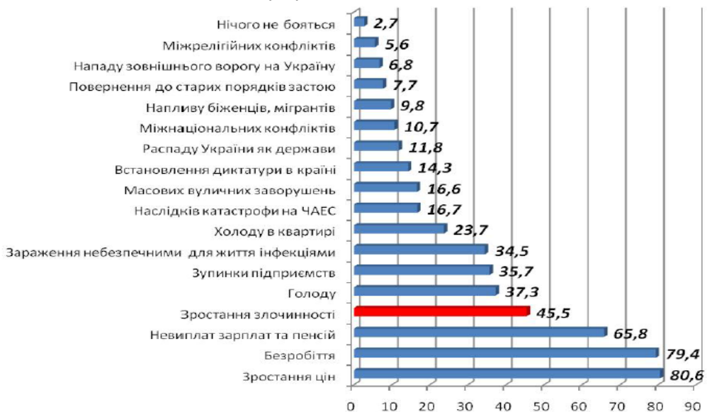
Рис. 2. Найбільш поширені страхи в громадській думці громадян України у 2012 році, %*

Лінія тренду на рис. 1 свідчить, що за збереження існуючих тенденцій у сфері злочинності її рівень протягом 2012 р. і подальших років буде підвищуватись, що негативно впливатиме на демографічний потенціал нації.