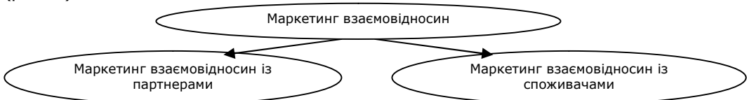
Рис. 1. Напрями реалізації маркетингу взаємовідносин туристичного підприємства

Взявши до уваги дану тенденцію, ми пропонуємо сучасну концепцію маркетингу взаємовідносин туристичного підприємства розглядати в двох напрямках: взаємовідносини з споживачами та взаємовідносини з партнерами (рис. 1).