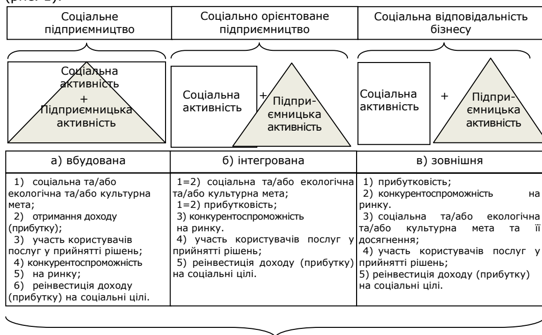
Критерії соціального підприємництва

Як зазначають фахівці Британської ради, соціальне підприємство – це бізнес, спрямований переважно на соціальні цілі, з прибутками, що переважно скеровуються на саморозвиток, громадські справи чи розв’язання соціальних проблем [7]. У теоретико-прикладному аспекті необхідно розрізнити поняття «соціальне підприємництво» та «соціальна відповідальність бізнесу» за ступенем інтеграції соціальної і бізнес-активності (рис. 1).