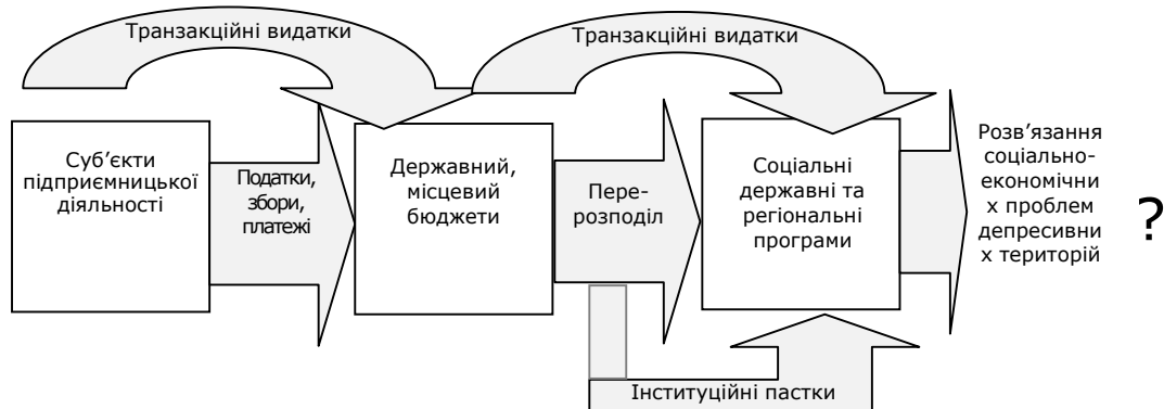
Рис. 2. Концептуальна схема скерування фіскальних зборів для реалізації соціально-економічних програм розвитку депресивних територій*

Сьогодні розвиток соціального підприємництва через підтримку розвитку малого бізнесу сільських поселень є чи не єдиним можливим пріоритетом їх ревіталізації. Можемо констатувати, що інвестиції у соціальні, екологічні, культурні та інші проекти як результат функціонування соціальних підприємств є ефективнішими для реалізації антидепресивної політики, ніж реалізація відповідних соціальних державних та регіональних програм (рис. 2).