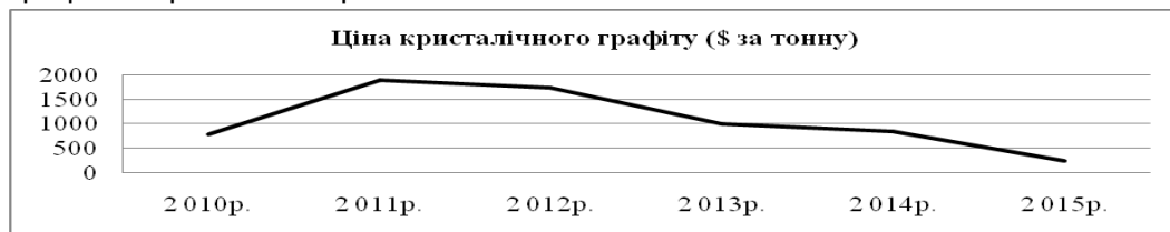
Рис. 3. Динаміка цін на кристалічний графіт*

Що ж до стратегічного планування на підприємстві ПАТ «Український графіт», то можна зазначити, що необхідно надалі удосконалювати якість та асортимент продукції шляхом розробки нових технологій. Також ми проаналізували ринок, на якому функціонує підприємство, та можемо зазначити, що графіт має попит у виробництві електромобілів та установок «зеленої» енергетики. На ринку електромобілів у 2015 р. відбувся різкий стрибок попиту на них, наприклад в Китаї попит зріс утричі (з 59000 авто до 189000 авто на рік), у Великобританії та Франції з 16500 авто до 28000 авто на рік. Отже, якщо зростання попиту збереже дану тенденцію, то до 2030 р. 30% власників машин матимуть саме екологічно чисті машини. На ринку спостерігається нестача якісних та потужних акумуляторів і батарей [10]. Таким чином, ми пропонуємо підприємству ПАТ «Український графіт» розглянути дані тенденції розвитку екологічно чистих машин та «зеленої» енергетики та розглянути можливість виходу на ринок поставок матеріалів та сировини для виготовлення акумуляторів і батарей. Динаміка цін на графіт зображена на рис. 3.