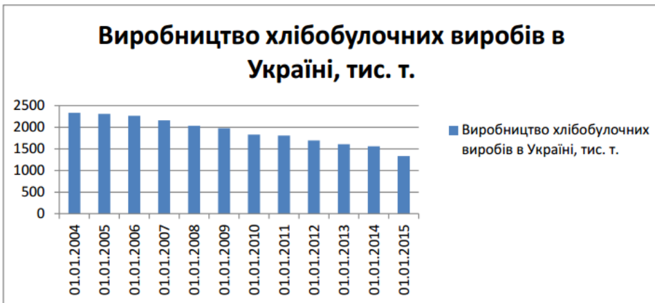
Рис. 1. Динаміка виробництва хлібобулочних виробів в Україні за 2004-2015 рр.(тис. т.) [7]

Негативна тенденція спостерігається в збільшенні частки збиткових підприємств хлібопекарської галузі в Україні, зокрема в 2014 році вона зросла до 40%. У той же час відбувається масовий відхід ринку в тінь. За різними підрахунками, частка тіньового виробництва в галузі нині становить від 40 до 70%. Про це свідчать нереально низькі дані офіційної статистики – згідно з ними сьогодні в Україні виробляється 101 г хліба на людину в день, що має розходження з реальним рівнем споживання як мінімум у півтора рази.