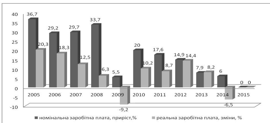
Рис. 3. Динаміка номінальної та реальної заробітної плати в Україні*

Для порівняння зауважимо, що, наприклад, у США тільки 5–6% працюючих одержують заробітну плату, нижчу за межі бідності, при цьому мінімальна заробітна плата забезпечує близько 140% прожиткового мінімуму [10].