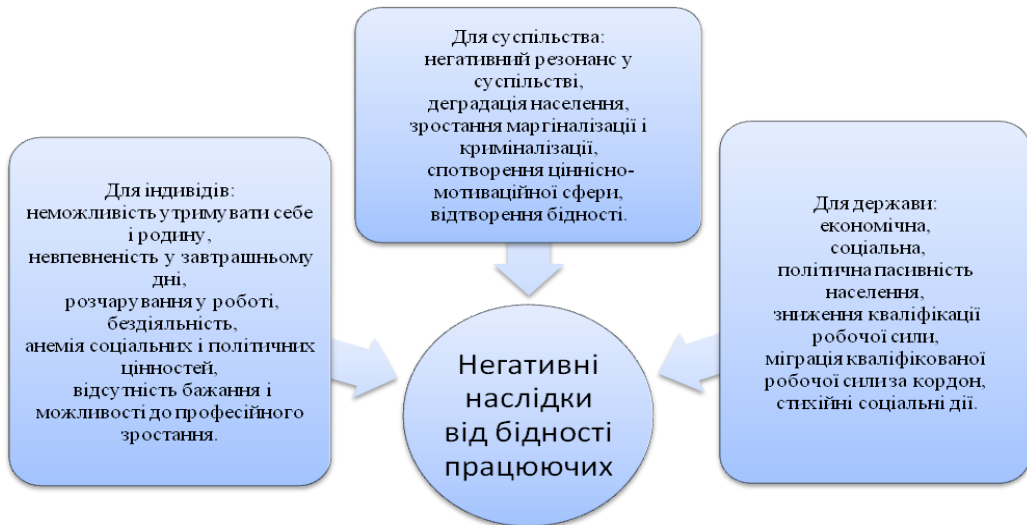
Рис. 2. Негативні наслідки від бідності працюючих

диференціацію рівня їх життя, і саме таким чином визначає рівні бідності. З точки зору рівня оплати праці бідність також обумовлюється розвитком ринку праці через галузеві, кваліфікаційні, регіональні та інші відмінності.