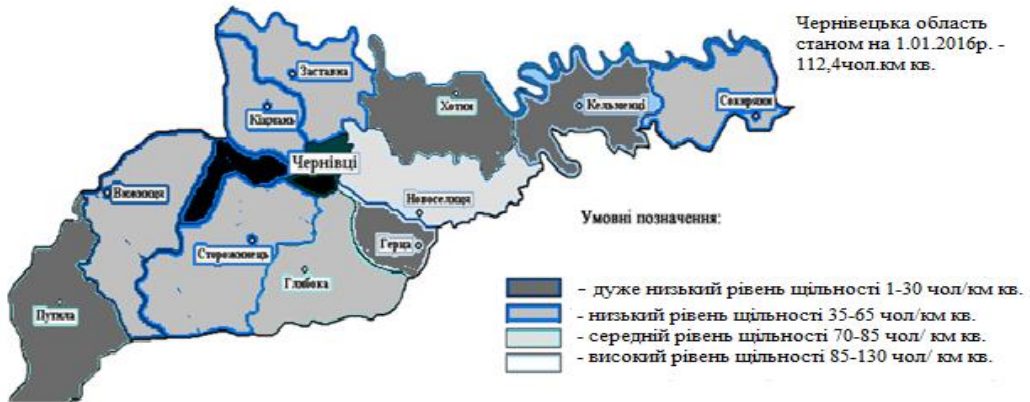
Рис. 1. Групування населення Чернівецької області за показником щільності (за даними 2015 р.), осіб/кв.м*

щільності – Герцаївський (107,4 чол./км 2 ), Глибоцький (109,9 чол./км 2 ), Кіцманський (113,85 чол./км 2 ) Новоселицький (105,8 чол./км 2 ) райони.