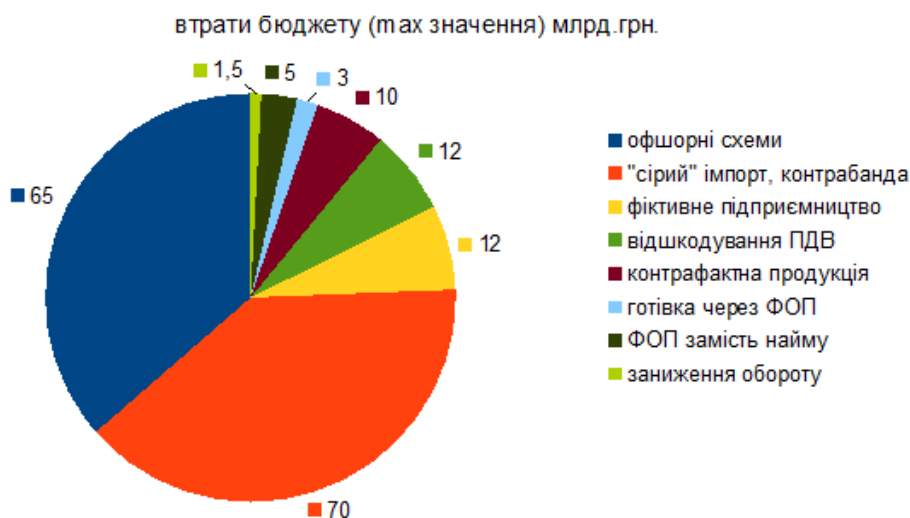
Рис. 1. Основні схеми ухилення від оподаткування в Україні за 2016 р.*

Аналізуючи наведені дані, можемо зробити висновок, що найбільша проблема в частині втрат бюджету – не заниження виручки та готівкові розрахунки через ФОП, а реальні офшори та контрабанда, які складають відповідно 41% та 38%. В той же час втрати, пов'язані з можливим застосуванням ССО, становлять близько 5,5% сукупних втрат бюджету. Отже, першочерговими завданнями уряду є заборона виведення капіталу до реальних офшорів за межами України та боротьба з контрабандою.