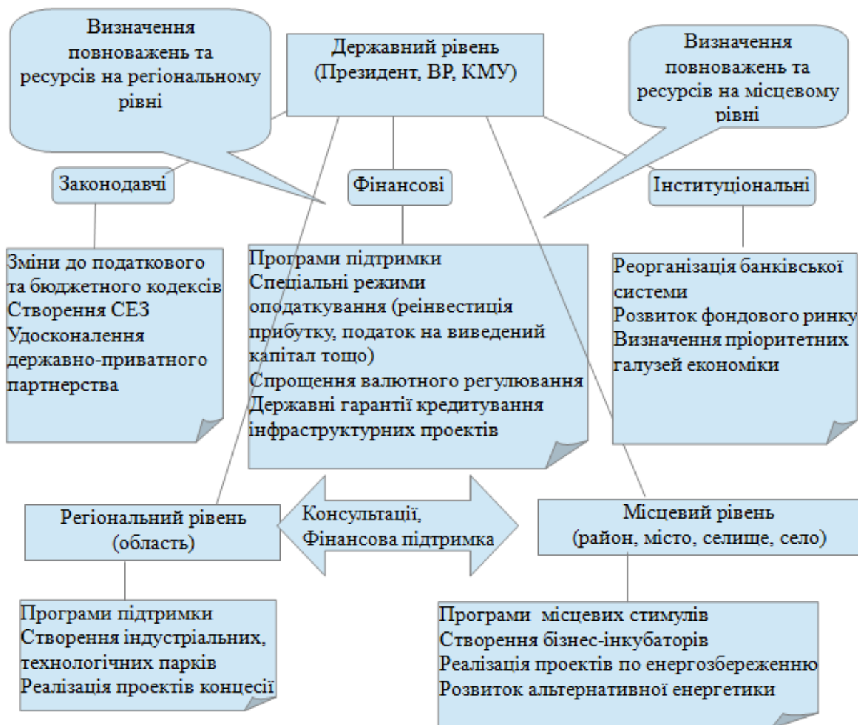
Рис. 3. Механізм та інструменти залучення інвестицій*

Важливим інструментом для інституціональних перетворень та активізації сектору МСП може стати реалізація державної стратегії розвитку малого і середнього підприємництва в Україні на період до 2020 року [14].