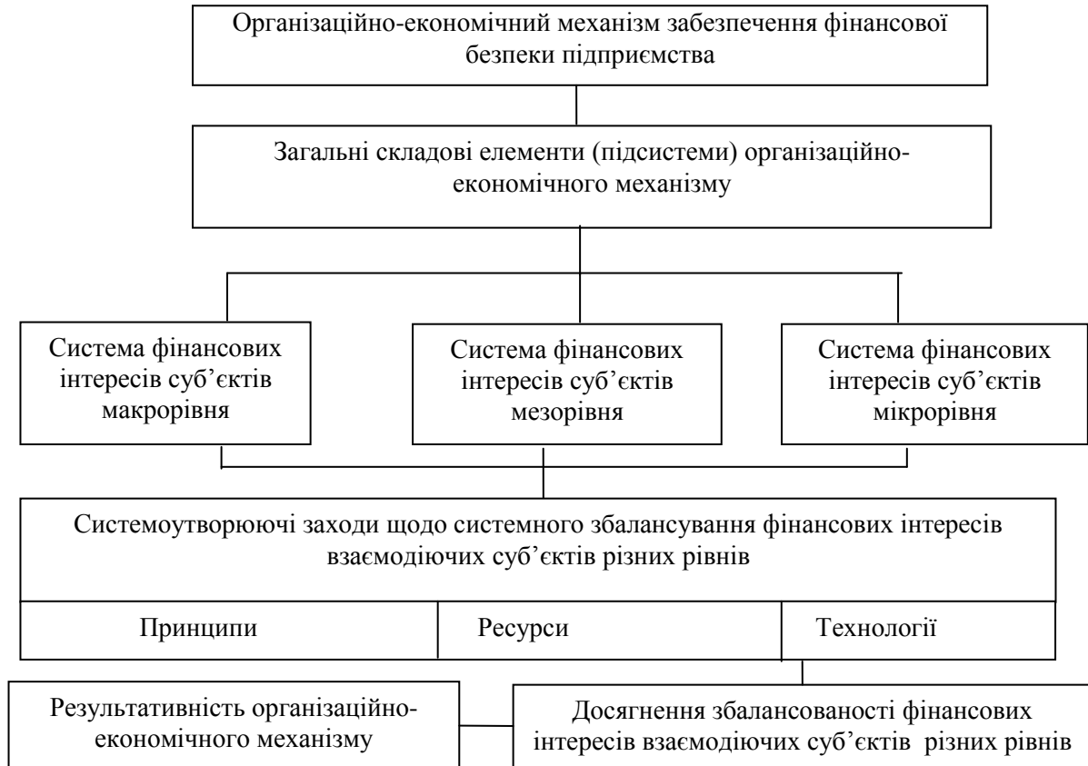
Рис. 1. Концептуальний підхід до формування структурно-логічної моделі механізму забезпечення фінансової безпеки підприємства

Побудова організаційно-економічного механізму, що дозволяє ефективно впливати на підприємство, повинна складатися з таких дій :