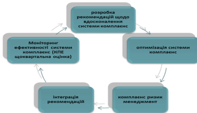
Рис. 2. Цикл розвитку системи комплаєнс в банках (сформовано авторкою)

Банківська установа також має керуватися принципом циклічності задля підвищення своєї конкурентоспроможності, отже авторка пропонує розглянути створений нею на основі попередньої схеми та із врахуванням наробок науково-дослідницької діяльності, цикл розвитку системи комплаєнс в банківській інституції України, що є актуальним й динамічним елементом банку (рис.2).