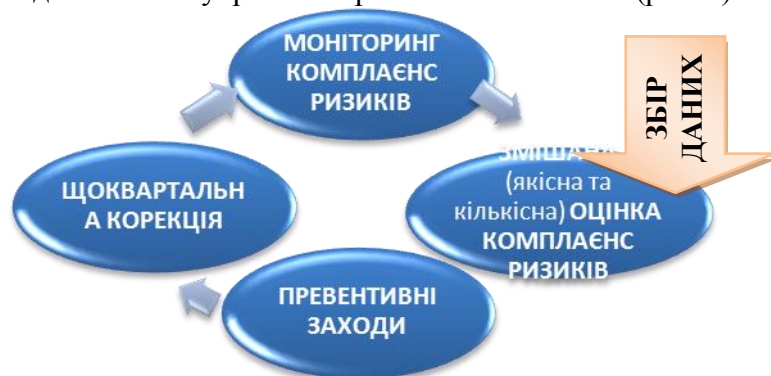
Рис. 4. Загальний цикл комплаєнс менеджменту банку

За проведеними дослідженнями та на базі ПАТ «КБ» Глобус», АТ «Ощадбанк», ПУАТ «ФІДОБАНК», Erstebank Erstegroup, АТ «Родовід банк» авторкою ідентифіковано комплаєнс ризики та систематизовано базовий каталог комплаєнс ризиків та створено графічну модель, що представляє базис для системи управління ризиками комплаєнс (рис. 4).