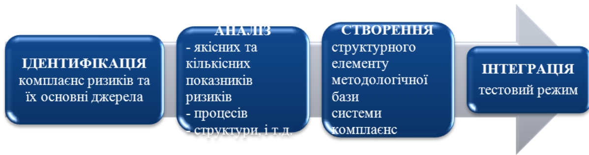
Рис. 1. Первинна базова модель поетапного формування системи комплаєнс в банківських інституціях «чотири кроки» (розробка авторки)

Банківська установа також має керуватися принципом циклічності задля підвищення своєї конкурентоспроможності, отже авторка пропонує розглянути створений нею на основі попередньої схеми та із врахуванням наробок науково-дослідницької діяльності, цикл розвитку системи комплаєнс в банківській інституції України, що є актуальним й динамічним елементом банку (рис.2).