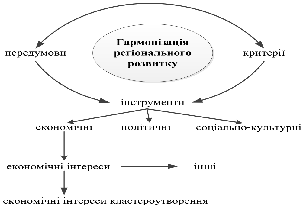
Рис. 2. Економічні інтереси як інструмент управління гармонізацією регіонального розвитку