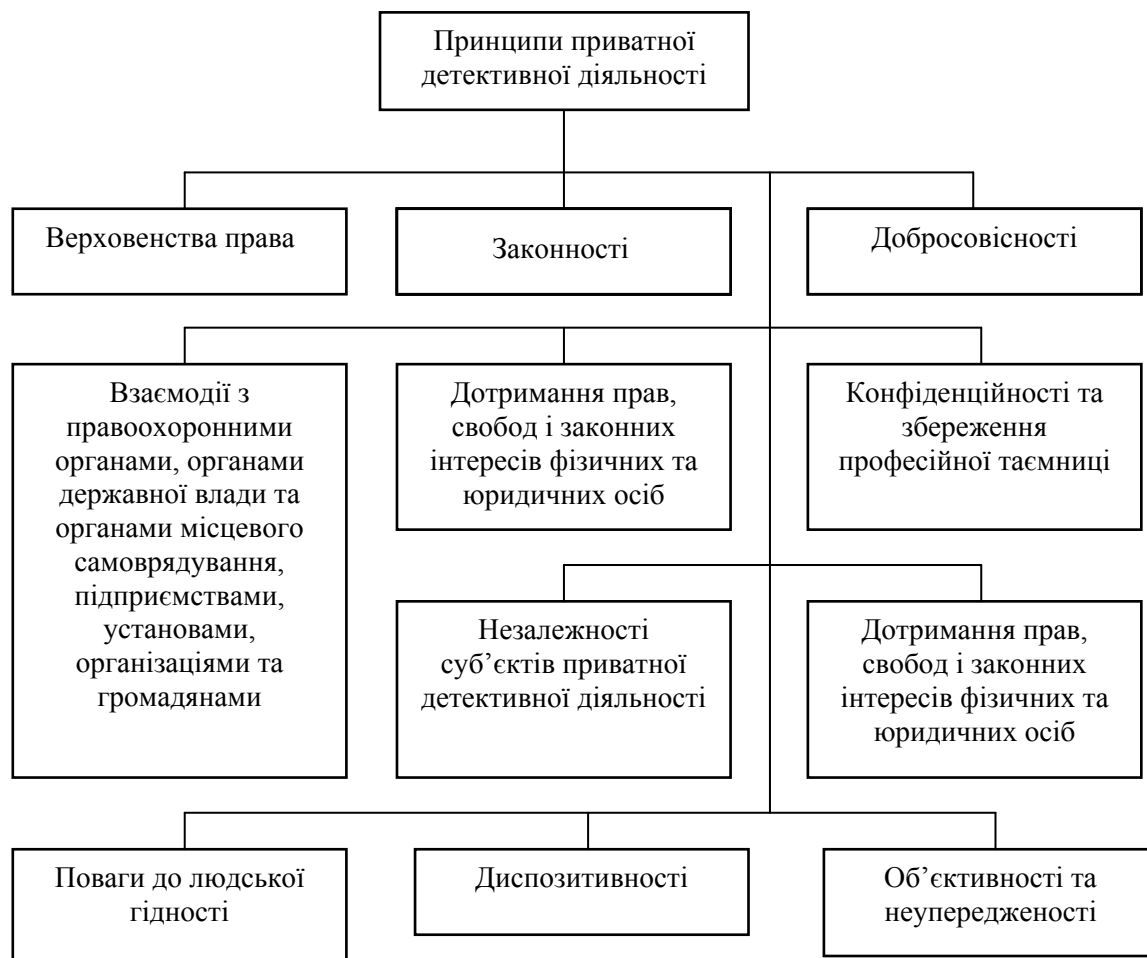
Рис.1. Основні принципи здійснення приватної детективної діяльності розроблено автором на основі [1].

Ситуацію з впровадження приватної детективної діяльності також у значній мірі ускладнюють історія, традиції та ментальність в сфері правоохоронної діяльності, які дісталися нам від колишнього радянського союзу і жаль, як і раніше в тій чи іншій мірі зберігаються і в даний час.