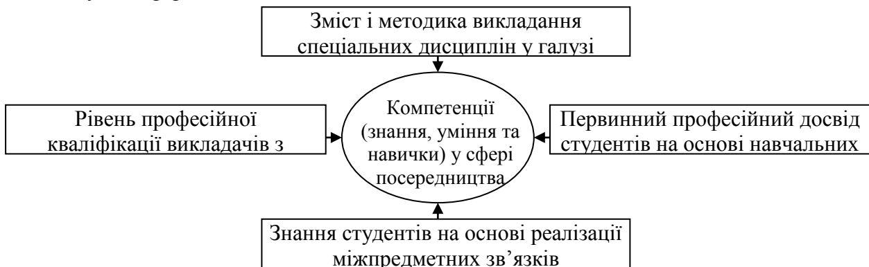
Рис. 1. Вплив педагогічних чинників на формування професійної компетентності соціальних працівників у сфері посередництва

створюють передумови для інтеграції теорії і практики та здійснення професійного втручання в посередництві. Представлена модель дозволяє проаналізувати та зіставити новостворені освітні програми у сфері підготовки соціальних працівників із накопиченим досвідом, а також започаткувати формування нових програм професійної освіти у цій сфері.