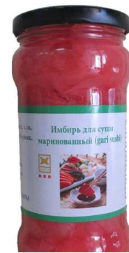
Рис. 2. Продукція харчової промисловості із вмістом імбиру

Настій з кануферу використовують як седативний, спазмолітичний, протисудомний, дезінфікуючий, антигельмінтний і як такий, що стимулює виділення шлункового соку, засіб. К. Лінней вважав кануфер радикальним засобом, який знешкоджує наркотичну