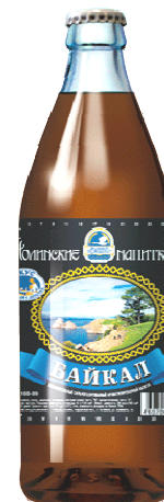
Рис. 1. Продукція харчової промисловості із вмістом евкаліпта

Імбир містить дуже складну суміш фармакологічно активних компонентів, серед яких гінгероли, \beta -каротин, капсаїцин, кофеїнова кислота, куркумін.