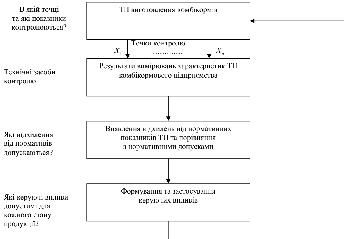
Рис. 2. Модель БІС контролю якості виготовлення продукції на ПАТ «Миронівський завод по виготовленню круп і комбікормів»

У результаті дослідження і застосування вищенаведених методів можна сформулювати модель БІС контролю якості виготовлення продукції на комбікормовому підприємстві, яка наведена на рис. 2.