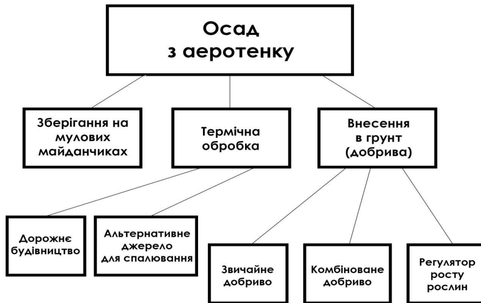
Рис. 3. Основні напрями утилізації осаду з аеротенку

виявлення доцільності його використання в сільському господарстві як добрива з використанням спеціальної обробки або без неї.