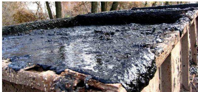
Рис. 1. Осад з аеротенку, підготовлений до транспортування на муловий майданчик

Постановка проблеми. Ресурси Землі – одне з найцінніших багатств людства, але сучасне нераціональне використання земельного ресурсу подекуди призводить до порушення якісного складу землі. До нераціонального використання земель можна віднести захоронення відходів від очисних споруд, а саме осаду активного мулу, який використовують в аеротенках. Накопичення великого об'єму осаду стічних вод (ОСВ) – актуальна проблема населених пунктів та промислових підприємств України. Об'єм осаду каналізаційно-очисних споруд (КОС) безперервно збільшується, і необхідно проводити дослідження, щоб зменшити території для зберігання цього осаду, представленого на рис. 1.