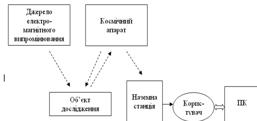
Рис. 1. Структурна модель використання дистанційного зондування на космічному рівні

Іноді постає завдання, щоб відзняти певну площу поверхні Землі вночі, тобто коли вона не є освітленою, або ж коли певна територія більшу частину часу перебуває під густим покривом хмар, або коли взагалі справджуються обидві умови. У такому разі використовується активне дистанційне зондування. За таких умов джерелом електромагнітного випромінювання є вже сам супутник реєстрації картинки з поверхні Землі. Він має бути оснащений активною оптико-електронною системою і для того, щоб зробити знімок певної ділянки, супутник має виконати дії на кшталт ехолота. Штучний космічний апарат має відправити сигнал, який сягне поверхні Землі. Після того, як він відіб'ється від її поверхні, супутник зареєструє відбите випромінювання і таким чином отримує дані про зображення об'єктів на ній.