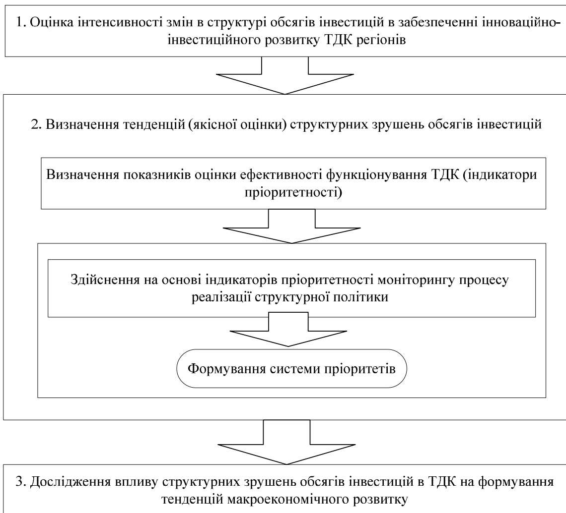
Рис. 3. Алгоритм комплексного аналізу структурних зрушень обсягів інвестицій в інноваційно-інвестиційний розвиток транспортно-дорожнього комплексу регіону

Для комплексного аналізу структурних зрушень обсягів інвестицій у забезпечення інноваційно-інвестиційного розвитку транспортно-дорожнього комплексу регіонів доцільно використовувати таку методику, алгоритм якої наведений на рис. 3.