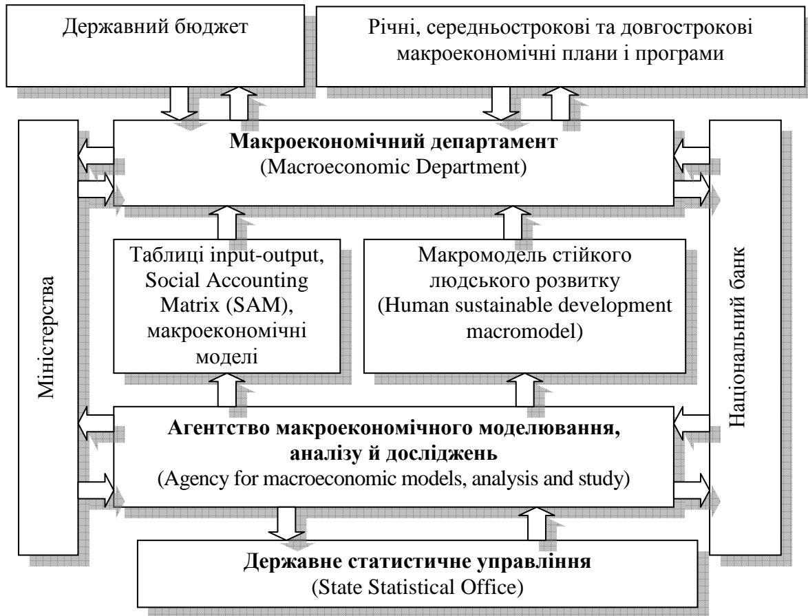
Рис. 1. Структура інституційної системи індикативного планування Республіки Македонія

Проблемам індикативного планування присвячені роботи і російських учених [1; 5-8], які розглядають індикативне планування як механізм координації інтересів і діяльності державних і недержавних суб'єктів управління економікою, який поєднує її державне регулювання з ринковим та неринковим її саморегулюванням і ґрунтується на розробленні системи показників (індикаторів) соціально-економічного розвитку. На думку С.М. Лавлінського [8, с. 12-13], індикативне планування – це процес формування системи індикаторів, що характеризують стан і розвиток економіки, в сукупності з механізмами державного регулювання соціально-економічних процесів, які забезпечують досягнення цільових значень індикаторів.